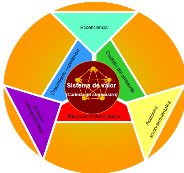
Figura 2 Cadena de Suministro. Un enfoque de desarrollo sustentable (Ptolomeo, 2008)

Básicamente se estarían integrando los aspectos sustentables ambientales, económicos y sociales. La convergencia del cuidado ambiental en conjunto con el crecimiento económico conlleva ecoeficiencia; mientras que al atender la responsabilidad social y el cuidado ambiental, se estaría centrando en acciones socio-ambientales; por otro lado la responsabilidad ambiental y el crecimiento económico implican acciones socio-económicas. Es el equilibrio y valor en la cadena en términos sustentables.